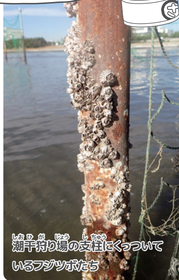
潮干狩り場の支柱にくっついているフジツボたち