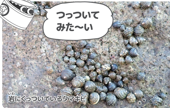
岩にくっついているタマキビ