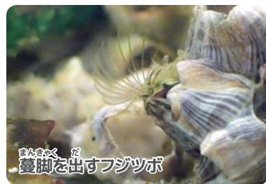
蔓脚を出すフジツボ

こんなときでも変わらず姿が見られるのが、くっついてくらす生きもの。潮干狩り場のネットや支柱を観察すると、くっついているフジツボを見ることができます。フジツボたちは、潮が引くとふたを固く閉じてほとんど動きませんが、